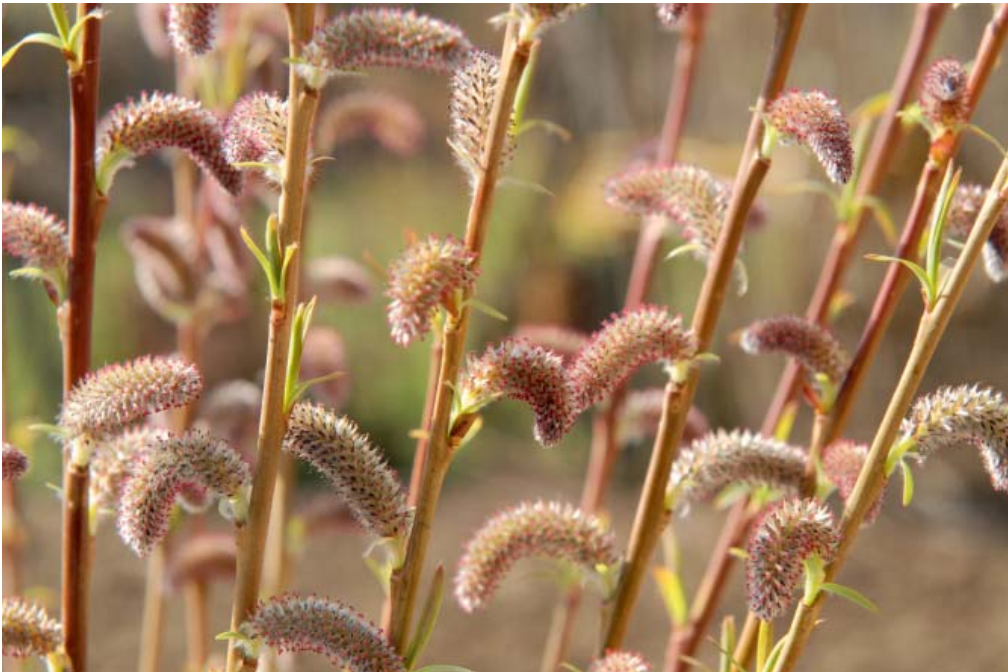
Biegsame Schönheiten: S. daphnoides 'Praecox' (oben links), Salix bögelsackii (oben rechts) Salix purpurea 'Eugenii' (Mitte), S. nigricans ssp. alpicola (unten links) und Salix purpurea ssp. purpurea (unten rechts).