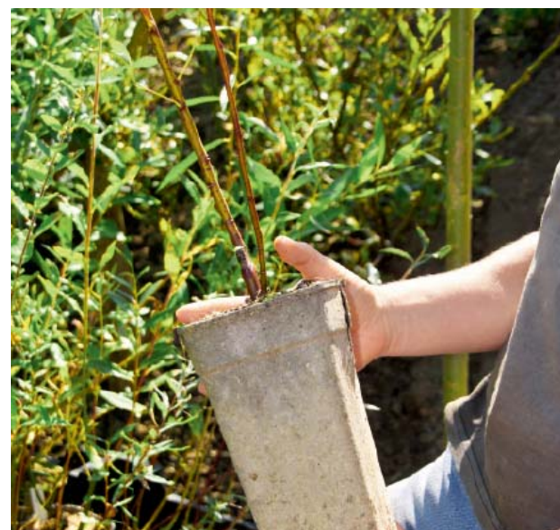
... die diversen Salix -Arten und -Sorten – in erster Linie durch Stecklinge.