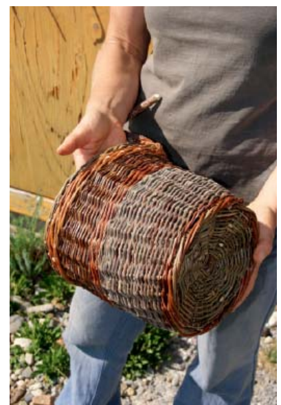
... als Ausgangsmaterial für Flechtwaren wie diesen Gartenkorb.