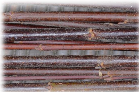
Frisch geerntete Ruten