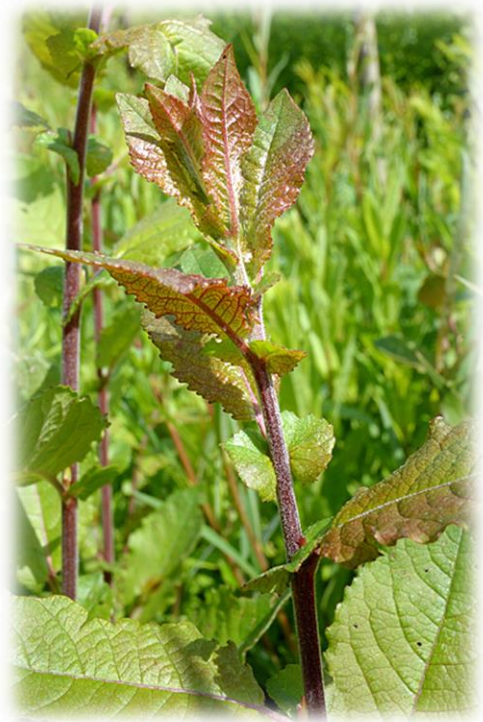
'Black Lady' in der Kultur