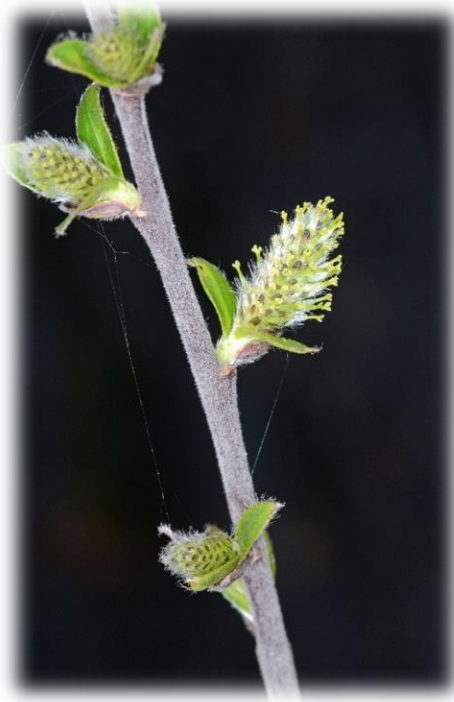
Weibliche Kätzchen zusammen mit Blatt- austrieb